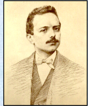
Giuseppe Antonio Tovini

Diventa sindaco di Cividale, promotore e realizzatore di numerose opere di pubblica utilità, di banche, di giornali, di scuole e pensionati universitari, e tanto altro ancora. Muore a