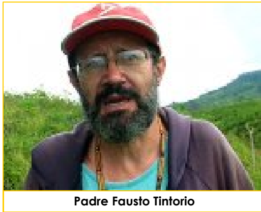
Padre Fausto Tintorio

Nella seconda metà del mese di ottobre viene ucciso nelle Filippine un prete italiano 59enne Fausto Tintorio, missionario del PIME (Pontificio Istituto Missioni Estere). Tatay Pops ( grande papà ), come veniva chiamato, viveva nell'isola dal 1987 per portare aiuto sostegno e riconoscimento dei diritti alle tribù indigene dei Manobo, indigeni minacciati dalla crescente richiesta di esproprio delle terre per