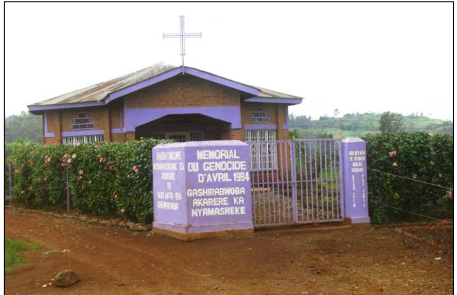
Uno dei tanti memoriali del Genocidio del '94

La base economica del Paese è costituita essenzialmente dall'agricoltura di piantagione, che occupa la maggior parte della forza lavoro. Manioca, patata, sorgo, e legumi, coltivati per il mercato interno, risultano insufficienti per soddisfare il fabbisogno della popolazione. Sono coltivati per l'esportazione il caffè e il thè. L'allevamento di bovini e caprini è limitato dalla mancanza di spazi. La pesca è un'attività di modesta importanza, praticata soprattutto nel Lago Kivu (gustosissima la frittura di pesciolini di lago). Ricchi giacimenti di gas naturale si trovano sotto il Lago Kivu (che tutto ciò non sia tra i motivi delle guerre con la Repubblica Democratica del Congo?). Sono presenti piccoli stabilimenti per la produzione di cemento (non ci crederete, ma è ancora possibile vedere i ta-