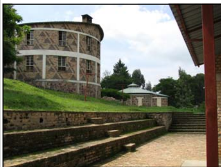
Orfanotrofio St. Antoine - struttura interna

Athanase Seromba: prete cattolico rwandese, direttamente coinvolto negli omicidi dei tutsi, nel 1997 si era rifugiato a Firenze con incarico presso una parrocchia. Il sacerdote, non estradato, si è consegnato solo il 6 febbraio 2002 al Tribunale Criminale Internazionale per il Rwanda, ad Arusha, dove è stato processato per