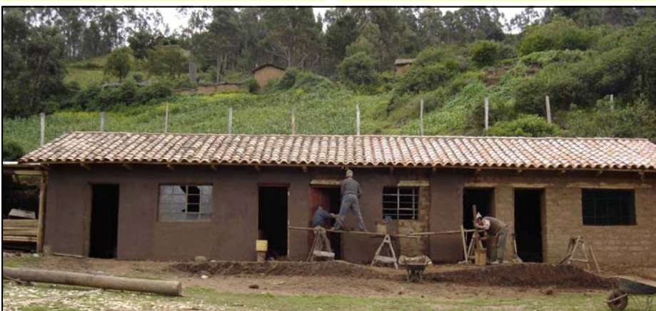
Casa del Villaggio per Anziani "Padre E. Salimbeni" Cotabambas - Perù

Via G.Giusti, 28 - 00034 Colleferro Via Q. Sella, 72 - 70122 Bari 380.4758660/680 www.karibuonlus.it info@karibuonlus.it Responsabile: p. giuliani