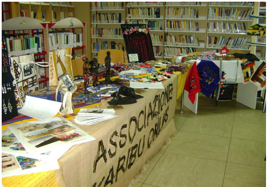
Iniziativa "Un libro per un sorriso" a Paliano