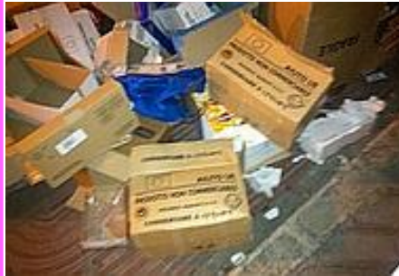
Foto dei cartoni fotografati

Ovviamente, le smentite nei vari mezzi di informazione sono prontamente arrivate da chi è stato coinvolto dallo scoop: l' Associazione InConTra, il Gruppo di Ascolto "don Pietro Mercurio" e la Parrocchia di San Rocco .